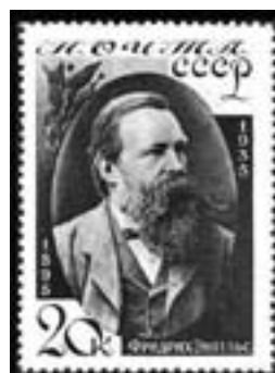
Sowjetische Briefmarke zum 40. Todestag

Ausländische Genossen werden es uns gewiß nicht verübeln, wenn wir stolz darauf sind, daß Friedrich Engels und Karl Marx Deutsche waren. Denn für wen, wenn nicht für sie, treffen die ersten Sätze des aus Engels' Feder stammenden Buches „Der deutsche Bauernkrieg“ wohl so genau zu: „Auch das deutsche Volk hat seine revolutionäre Tradition. Es gab eine Zeit, wo Deutschland Charaktere hervorbrachte, die sich den besten Leuten der Revolutionen anderer Länder an die Seite stellen können, wo das deutsche Volk eine Ausdauer und Energie entwickelte, ... mit Ideen und Plänen schwanger (ging), vor denen ihre Nachkommen oft genug zurückschauern.“ (MEW, 7/329)