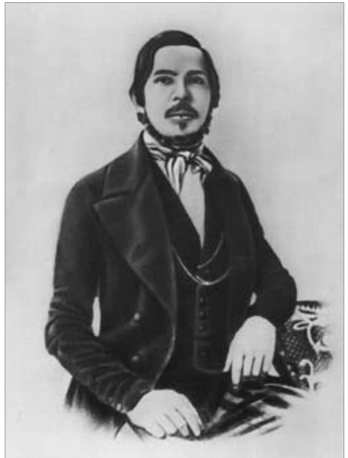
Der junge Friedrich Engels, ca. 1844

Ehrbare Jungfrau! Ich, nach viel und schwerem Ringen Gegen die Lust der Welt, die gegen mich tat dringen, Komm ich mit dem Gesuch, ob sie mich wollte nicht Nehmen zu ihrem Mann, in Ehrbarkeit und Pflicht. Zwar liebe ich sie nicht, das wär' zu viel verlangt, Ich lieb in ihr den Herrn, der –