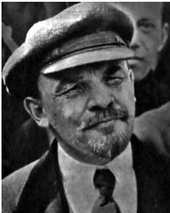
Wladimir Iljitsch Lenin

Wirkliche Freundschaft – das können wir bei Marx und Engels lernen – setzt nicht nur Gemeinsamkeit der Auffassungen, sondern immer