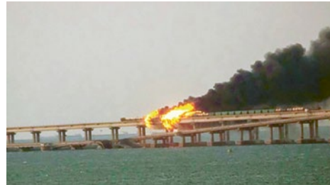
Krim-Brücke: Nach Angaben des russischen Ermittlungskomitees explodierte am Samstagmorgen ein Lastwagen auf dem Straßenteil der Krim-Brücke, wodurch sieben Treibstofftanks eines Eisenbahnzuges in Brand gerieten.

aufgelegten Beschränkungen aufgrund der Einstufung der Intervention als begrenzte, spezielle militärische Operation zu handeln. In diesem Fall wird sich Präsident Putin rechtlich berechtigt fühlen, nicht nur wie bisher Befehle für chirurgische Präzisionsschläge in einer eng begrenzten Zielzone zu