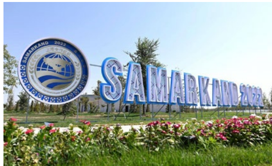
Samarkand wurde ungefähr 750 Jahre vor unserer Zeitrechnung gegründet

Betrachten wir das historische Beispiel Tibet. Tibet war jahrhundertlang Teil des chinesischen Reiches; in den 1920ern wurde es durch britische Kolonialtruppen von China abgetrennt, und die ebenfalls seit Jahrhun-