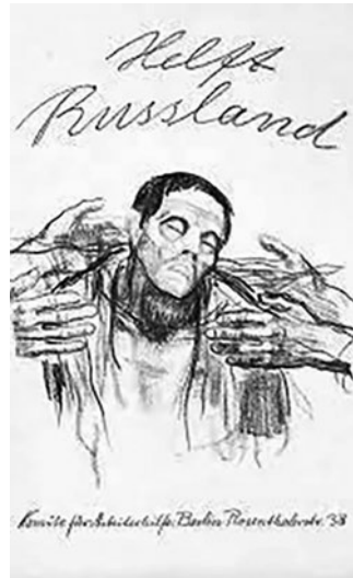
Plakat von Käthe Kollwitz zur Hungersnot in Sowjetrußland

ukrainischen Partei-Chefs Stanislaw Kossior an Stalin macht sich Kossior in herablassender Weise über die hungernden ukrainischen Bauern lustig, die viele spätere Historiker verleitet, diesen Brief als entscheidendes Beweisstück anzuführen, daß es sich bei der Hungersnot um einen gezielten Völkermord handeln müsse.“