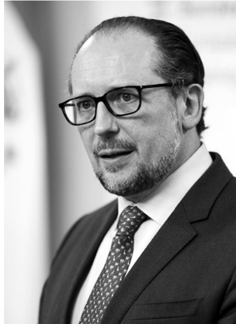
Österreichischer Außenminister Alexander Schallenberg

Beziehungen zum rechtmäßigen Präsidenten Alexander Lukaschenko. Statt dessen habe er sich entgegen jeglicher diplomatischer Gepflogenheit unter dem Vorwand einer angeblichen Wahlfälschung mehrfach mit der unterlegenen Präsidentschaftskan-