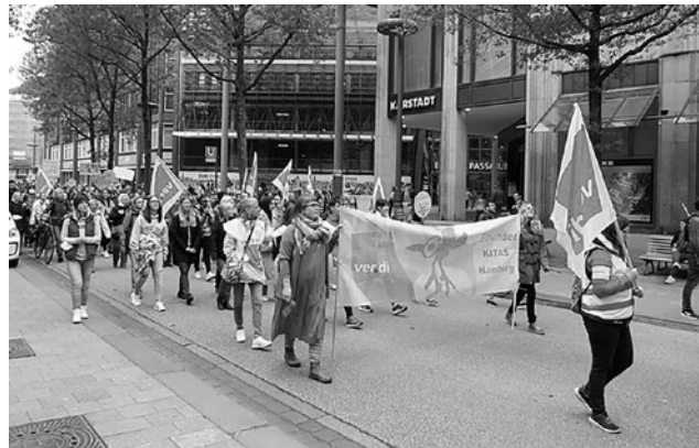
Wer „gibt“, wer „nimmt“ Arbeit: Kita-Warnstreik im Mai 2022 in Hamburg

Daraus folgt zweitens, daß die Bezahlung der Ware Arbeitskraft erst nach ihrer Anwendung im kapitalistischen Wirtschaftsprozeß erfolgt. Im normalen Geschäftsleben bedeutet eine solche Praxis Verkauf auf Kredit. Doch im Unterschied zur normalen Praxis bezahlen die Kapitalisten für den ihnen von den Arbeitern und Angestellten gewährten Kredit, d. h. die Lohn- und Gehaltszahlungen nach dem Verbrauch der von ihnen zur Verfügung gestellten Ware Arbeitskraft, keine Zinsen. Dadurch sparten die Kapitalisten der BRD im vorigen Jahr immerhin, bei einem angenommenen Zinssatz von 5 Prozent, 1,25 Mrd. DM!